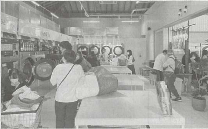
最新設備機器を設置した「eco ランドリープラス西貝塚店」