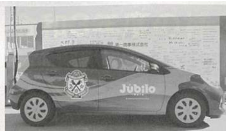
車体全面にオリジナルのラッピングがなされる