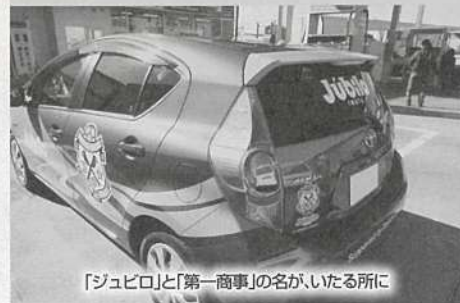
「ジュビロ」と「第一商事」の名が、いたる所に