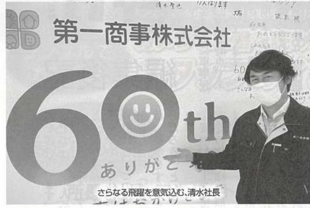
さらなる飛躍を意気込む、清水社長